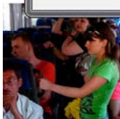
Дома лучше: беженцы бегут из России на Донбасс