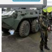
Более 20 российских БТРов обогнали "гуманитарку"